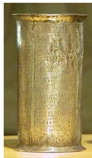
Une réplique d'un gobelet de Vicarello servira de témoin de relais tout au long du périple.