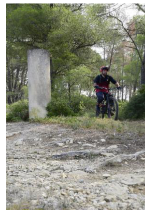
La Via Domitia et une borne milliaire à la hauteur de Mèze.

Une itinérance à vélo du Rhône aux Pyrénées du 19 au 27 septembre 2026